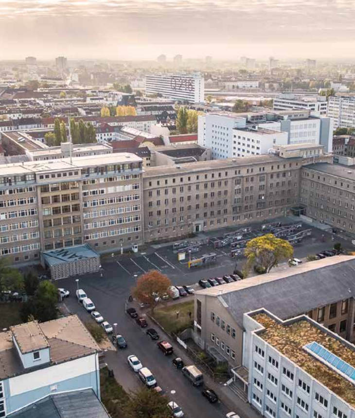
Das einst abgeriegelte Gelände bietet heute zahlreiche Besuchsangebote.